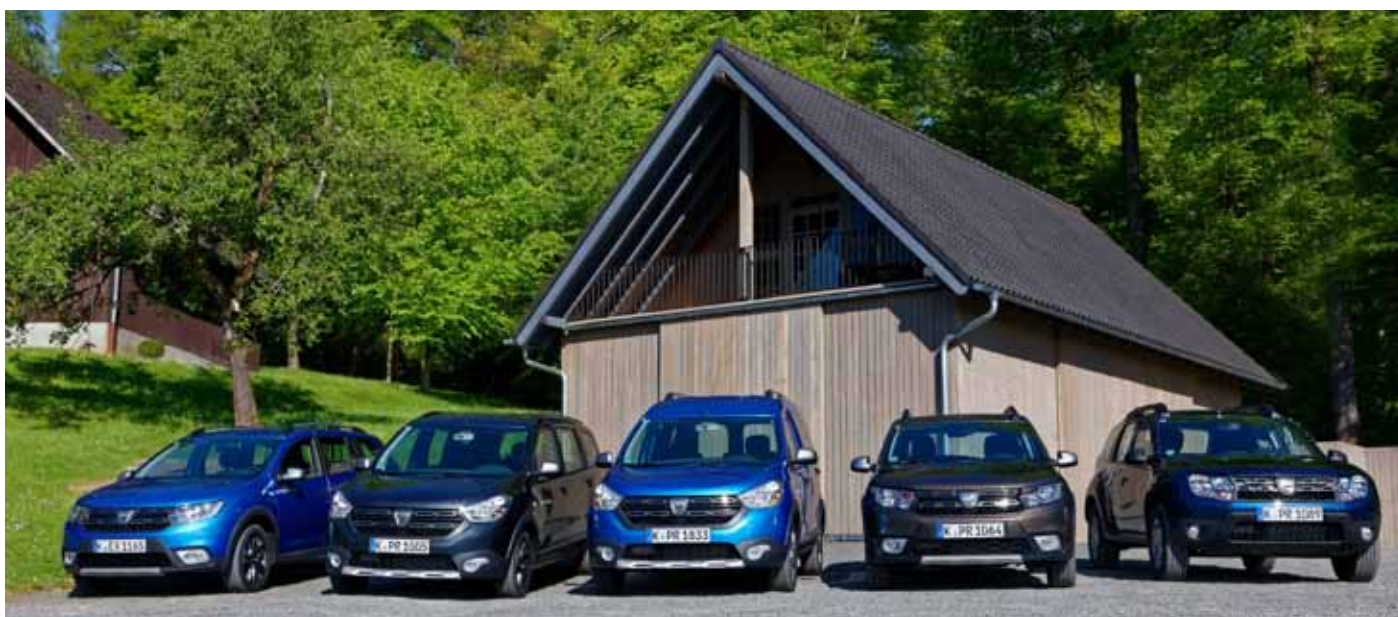
2017: Logan MCV Stepway, Lodgy Stepway, Dokker Stepway, Sandero Stepway, Duster