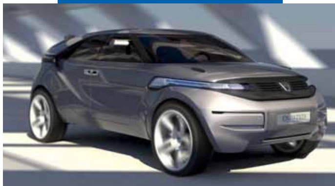
Blick in die Zukunft mit dem Konzept-Car