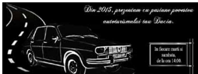
Blick in die Vergangenheit

Sprach man vor Jahren noch bei Daica von einem Selbstläufer ohne Werbung, so hat auch dieses sich geändert. Man holte sich Mehmet Scholl als Image-träger an Bord, man baute eine Fan-Seite bei Facebook auf und wurde im Fernsehen mit Werbspots aktiv. Schwer tat man sich jedoch mit Messeauftritten und der dortigen Kundenbetreuung. So musste sich der Kunde schon mal den Spruch „Was wollen Sie, das Fahrzeug kostet doch nur kleines Geld“ anhören. Kundenfreundlich ist etwas Anderes. Oder beim jährlichen Picknick-Treffen klappt es mit den Einladungen an die registrierten Dacia-Kunden nicht. Hier wird Dacia noch nachbessern müssen, denn nicht nur der Preis, sondern auch der Service führen zur Kundenbindung, auch bei einem „Preisbrecher“.