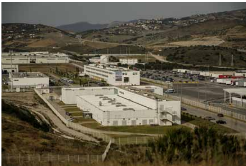
Der 300 Hektar große nordmarokkanische Standort wird zu 90 Prozent mit erneuerbaren Energien betrieben.