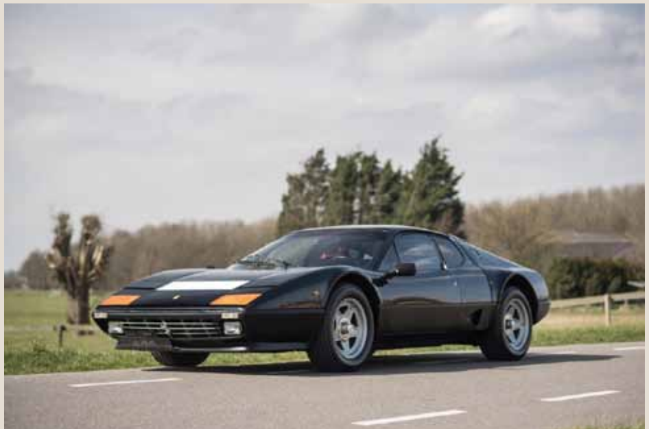
1983 Ferrari 512 I Berlineta Boxer mit Ermenegildo Zegna gestalteter Wolle innen

Text, Horst-Dieter Scholz