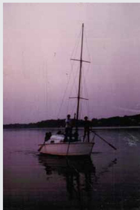
Segelbootfahrt auf der Masurischen Seeplatte