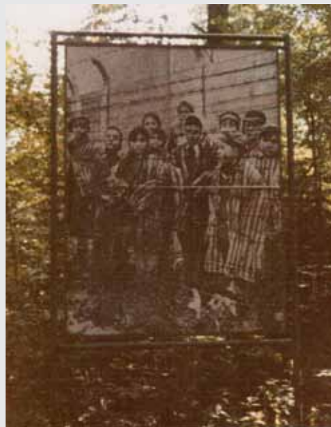
Tafel auf dem Gelände der Wolfsschanze (Aufnahme 1979)