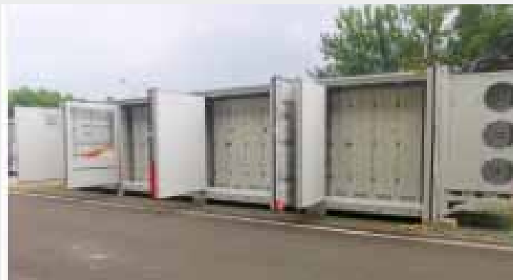
Hier eine Container mit Batterien als Speicherstation

Informationen: Agentur für Erneuerbare Energien e. V.