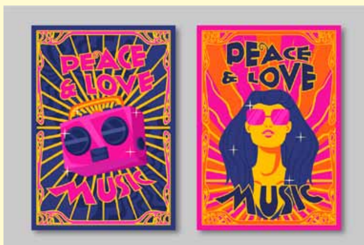
abstrakte psychedeli og Designtrends