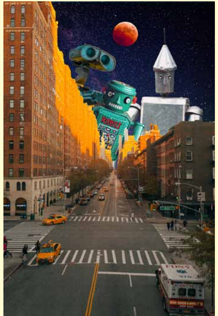
josh-couch-designtre s-2021-unsplash, Foto: Quelle: Josh Couch / Nick Owuor Astro / Phillip Glickman / Lenin Estrada / CJ Dayrit on Unsplash

Vielleicht hat Corona da ein wenig nachgeholfen, aber das Thema Umwelt und Natur wird in diesem Jahr sicher auch in der Gestaltung sichtbar bleiben. Der Wunsch vieler, nach draußen zu gehen und sich in der Natur aufzuhalten, ist riesig. Bilder aus der Natur sowie organische und natürliche Farben und Verläufe wirken auf den Betrachter entspannend.