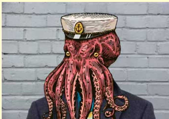
art.balitskiy on uns t-Grafikeinlage, Foto: Quelle: Salome Guruli on unspalsh / @art.balitskiy on freepik