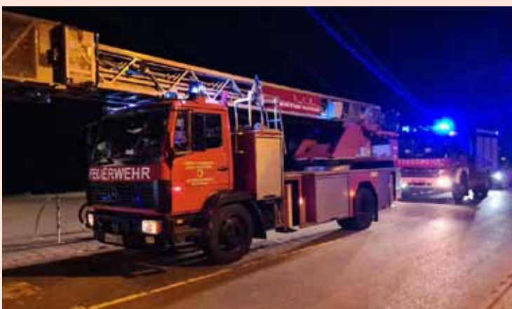
Feuerwehr Bleckede auf Anfahrt