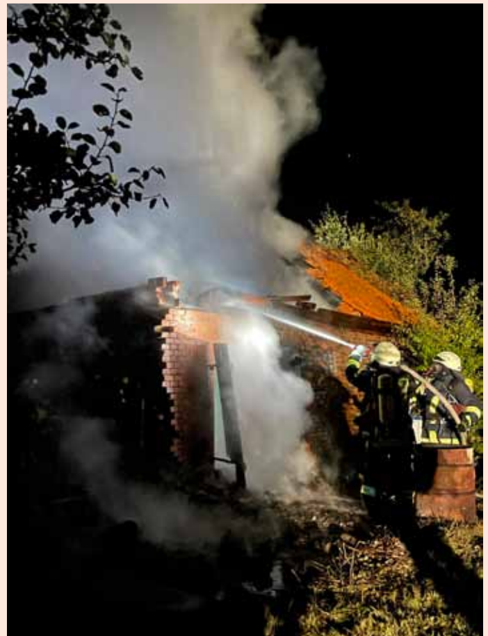
Löschen des Nebengebäudes