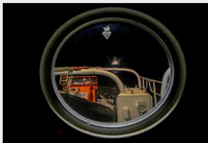
Blick nach achtern durch ein Bullauge des Seenotrettungskreuzers THEODOR STORM/DGzRS-Station Büsum auf den havarierten Fischkutter