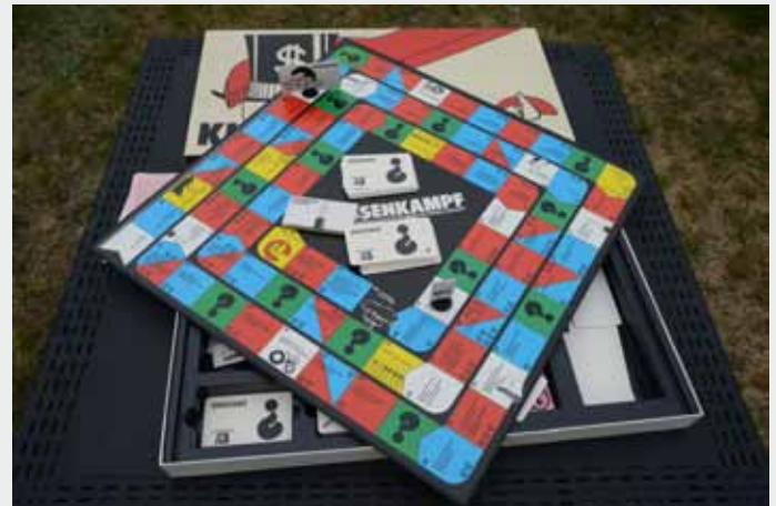
Klassenkampf aus dem Jahre 1979

Text.: Stadt Nürnberg Foto für ein besonders Spiel: Archiv ScholzFür Camping und Reise