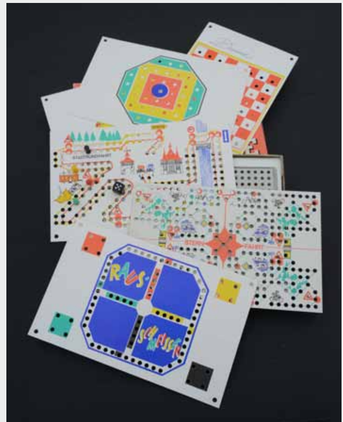
Für Camping und Reise aus der DDR