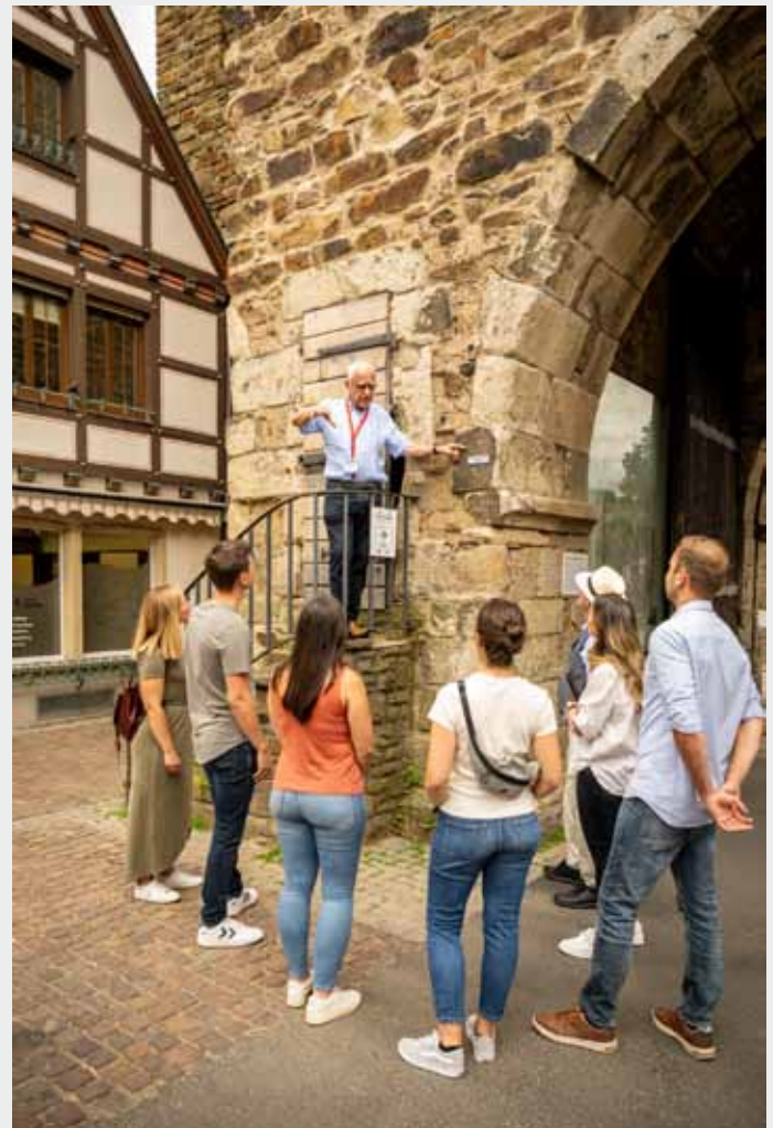
_Stadtführung ~au