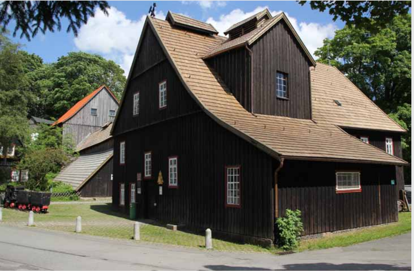
Schachtgebäude Grube Samson, (c) Jochen Klähn

werkseigenen Lore geborgen wurden. Wer sich für Kunst und Kulturschätze interessiert, sollte sich eine Ferienwohnung mieten, und das Bergwerk Grube Samson in St. Andreasberg besuchen. In dem UNESCO Weltkulturerbe, kann man sogar die Stollen besichtigen, die vor über 500 Jahren gebaut wurden. Ein perfekter Ausflug, um abends auf der gemütlichen Couch des Stadt Chalets in Braunlage den ein oder anderen Film zu genießen.