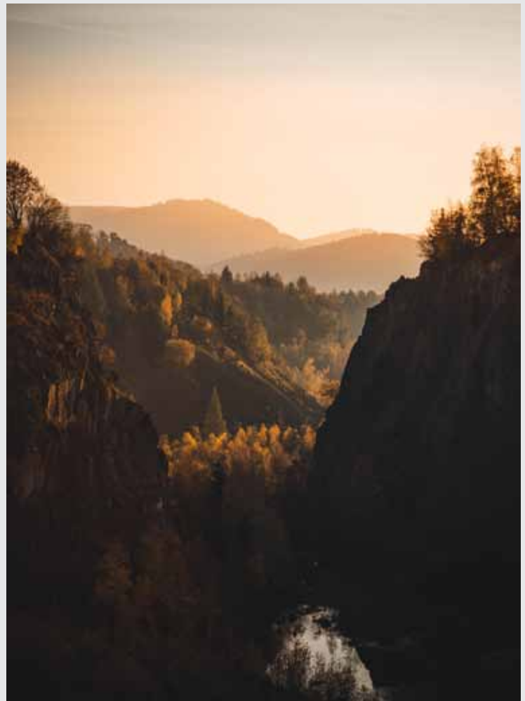
Harz Aussicht

Dieser Film brachte Hollywoods Top Schauspieler in den Harz! Hauptdarsteller und Regisseur George Clooney, Matt Damon, Bill Murray und John Goodman mimten in diesem Blockbuster eine amerikanische Truppe von Kunstschutzsoldaten. Diese versuchten im Auftrag ihrer Regierung den Verbleib von von Nationalsozialisten gestohlenen Kunstwerken aufzuklären, diese sicherzustellen und deren Rückführung vorzubereiten. Diverse Umwege und Abenteuer führen schließlich auch zu diversen wichtigen Drehorten im Harz: Die breite Straße in Goslar verwandelte sich für den Film in das belgische Viertel Veume, und das Erzbergwerk Rammelsberg zum Fundort wichtiger Kunstschätze, die in der berg-