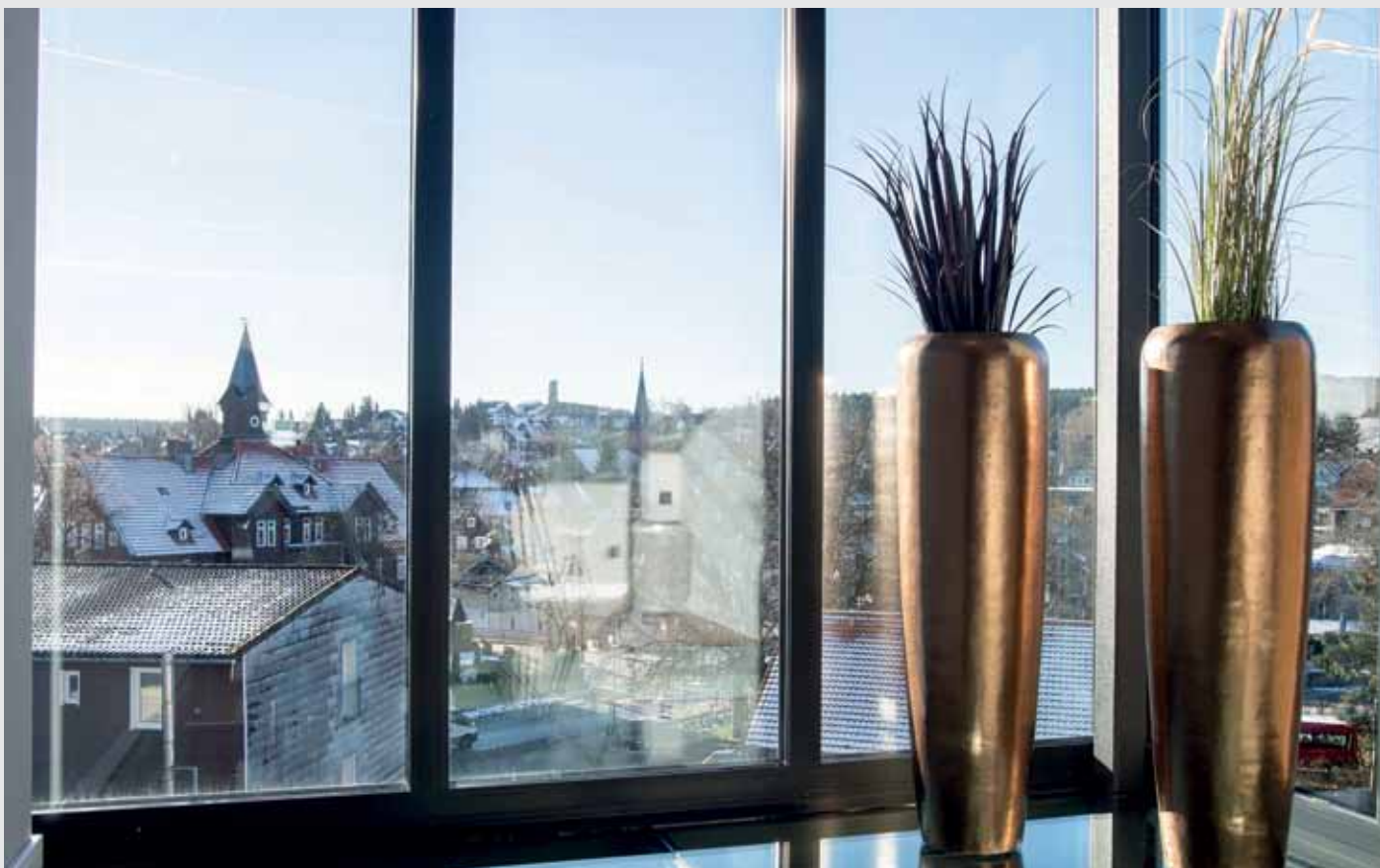
Turmhäuser Glasfront

Eine weitere Bestseller-Verfilmung bringt das mittelalterliche England in den Harz. Die Handlung ist im 11. Jahrhundert angesiedelt, als die Heilkunde und deren Lehre in Persien wesentlich fortgeschrittener war als in ganz Europa. Protagonist Robert Cole hat eine außergewöhnliche Gabe: Er kann fühlen, wenn